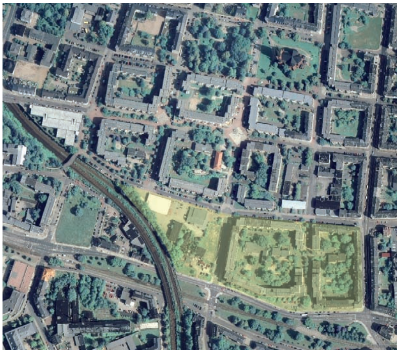
Das Quartier Sonnenberg mit der markierten Projektfläche (vor dem Gebäuderückbau) (Foto: Orthophoto 2007, Landesvermessungsamt Sachsen; Hervorhebung: bgmr)

Im Fokus der Neugestaltung stehen drei ehemalige Wohnblöcke im Süden des Stadtquartiers. In einer vertiefenden städtebaulichen Rahmenplanung wurden für diese Karrees Gestaltungs- und Nutzungskonzepte entworfen, die Machbarkeit der vorgesehenen Nachnutzungen und Ausstattungselemente auf den Abrissflächen geprüft und Vorschläge für Trägermodelle für die Flächennutzung entwickelt. Nach dem Rückbau von 474 Wohnungen steht ein Flächenpotenzial von ca. 1,7 ha zur Nachnutzung für die Bunten Gärten zur Verfügung, wobei das Konzept vorsieht, die bestehende Eigentümermischung der Grundstücke (die Stadt Chemnitz, das städtische Wohnungsbaununternehmen und eine Wohnungsbaugenossenschaft) beizubehalten. Das Projekt befindet sich derzeit in der Umsetzungsphase.