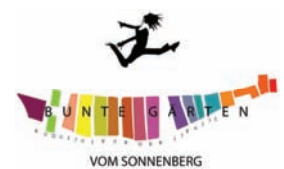
Logo für die Bunte Gärten (Entwurf: planart 4 , Leipzig)

Die Rahmenplanung wird auf ihre Realisierbarkeit geprüft und in einzelnen Bauabschnitten umgesetzt. Der Gebäuderückbau ist überwiegend abgeschlossen, gegenwärtig wird das multifunktionale Kleinspielfeld im Auftrag des Grünflächenamtes realisiert. Der weitere Umbauprozess wird in enger Zusammenarbeit mit der Stadt Chemnitz durch den Sanierungsträger und die Stadtteilgenossenschaft Sonnenberg eG, die von der Stadt als Quartiersmanager eingesetzt worden ist, in das Quartier hinein kommuniziert.