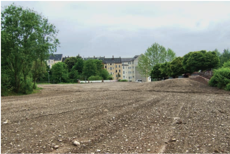
Rückbaufläche am Rand des gründerzeitlichen Stadtquartiers Sonnenberg

Für die Bunten Gärten ist durchgängig eine öffentliche Nutzbarkeit und eine barrierefreie Ausgestaltung der Anlagen vorgesehen. Eine attraktive Gestaltung und Nutzbarkeit mittels Farb-, Material- und Beleuchtungskonzept sowie die Schaffung offener Räume und verbesserter Freizeitangebote soll zur Imageverbesserung und Aufwertung des Stadtquartiers beitragen.